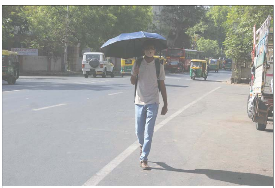
અમદાવાદમાં વધી રહેલ ગરમીના કારણે લોકો છત્રી લઈને બહાર નીકળી રહ્યા છે.

દિવ્યાંગતા ધરાવતા મતદારો ઘરે બેઠા પોસ્ટલ બેલેટથી મતદાન કરી શકે તેવી સુવ્યવસ્થા કરવામાં આવે છે. એ માટે ફોર્મ-૧૨ ડી ભરનારા ૩૪૭૭ જેટલાં ૮૫ વર્ષથી વધુ વયના, શતાયુ અને દિવ્યાંગ મતદારો માટે પોતાના ઘરેથી મત આપી શકે તેવી વ્યવસ્થા ઊભી કરવામાં આવેલી છે. આ મતદાન માટે તારીખ ૭ મે એપ્રિલથી તંત્ર દ્વારા તેમના ઘરે ઘરે જઈ મત મેળવવાની વ્યવસ્થા શરૂ કરવામાં આવી હતી. જેમાં આજ દિન સુધીમાં અમદાવાદ જિલ્લામાં કુલ-૨૬૪૦ જેટલાં ૮૫ વર્ષથી વધુ વયના, શતાયુ અને દિવ્યાંગ મતદારો ઘરે બેઠા પોસ્ટલ બેલેટથી મતદાન કર્યું છે. આ પ્રક્રિયા આગામી તારીખ ૫ મે સુધી ચાલશે. આ ઉપરાંત જેમણે