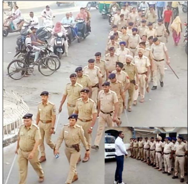
આગામી લોકસભા ચૂંટણી અનુસંધાને નડીયાદ ટાઉન પોલીસ (દ્વારા) પોલીસ સ્ટેશનથી નડીયાદ શહેરના અલગ-અલગ વિસ્તારમાં પોલીસ સ્ટાફને સેફ્ટી ગવર્નિંગના જવાબોને સાથે સાપ્તિ ટાઉન વિસ્તારમાં ફૂટ-પેટ્રોલિંગ કરવામાં આવ્યું.

પાટણ, પાટણ જિલ્લાના સિદ્ધપુરમાં ચૂંટણીલક્ષી કામગીરીમાં જોડાયેલા શિક્ષક મંગળવારના રોજ મતદાનની કાપલીઓનું વિતરણ કરવા માટે નીકળ્યા હતા ત્યારે તેઓને છાતીના ભાગે ડુબાવો ઉપડતા તેઓ ઠળી પડતા તેઓને તાત્કાલિક સારવાર અર્થે હોસ્પિટલ ખાતે ખસેડવામાં આવ્યા હતા ત્યાં ફરજ પરના તબીબે તેઓને મૃત જાહેર કરતા સિદ્ધપુરના શિક્ષણ આલમ સહિત મૃતકના પરિવારજનોમાં શોકની કાલીમાં ઇલાઈ જવા પામી હતી. આ બાબતે મળતી હકીકત મુજબ સિદ્ધપુર તાલુકાના ખળી ગામે પ્રાથમિક