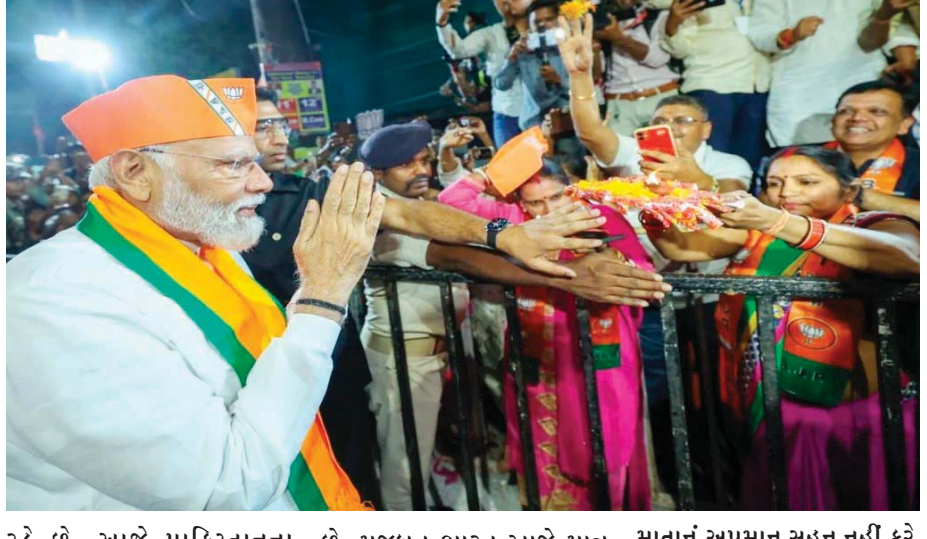
પીએમએ કહ્યું કે તેઓ ભારત માતાનું અપમાન સહન નહીં કરે. આ નવું ભારત છે, ઘરમાં ધૂસીને મારે છે. ભારતે પાકિસ્તાનને

કોંગ્રેસની ૨૨૫૦ કરક સરકાર દુનિયામાં જઈને ૨૩તી હતી. આજે પાકિસ્તાન દુનિયામાં જઈને ૨૩ છે. આજે પાકિસ્તાનના નેતાઓ કોંગ્રેસને પીએમ બનાવવા માટે પ્રાર્થના કરી રહ્યા છે. મજબૂત ભારત આજે માત્ર એક મજબૂત સરકાર ઈચ્છે છે. પીએમએ કહ્યું કે તેઓ ભારત માતાનું અપમાન સહન નહીં કરે. આ નવું ભારત છે, ઘરમાં ધૂસીને મારે છે. ભારતે પાકિસ્તાનને