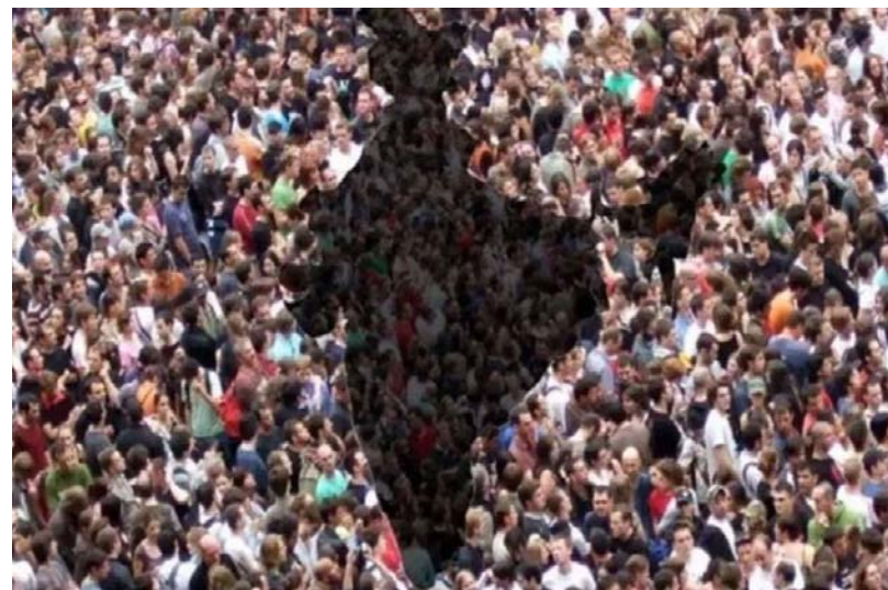
અછતને કારણે ભારતને પણ સમસ્યાનો સામનો કરવો પડશે. વિકસિત દેશોમાં પણ જન્મ-મૃત્યુ દરમાં અસંતુલન સર્જાયું છે. અભ્યાસ મુજબ ૨૦૩૦ સુધીમાં સ્પેન, દક્ષિણ કોરિયા, રશિયા, સિંગાપોર અને જર્મનીની વસ્તીમાં ઘટાડો થવા લાગશે. આ સિવાય ભારત, નેપાળ, શ્રીલંકા અને મ્યાનમારની વસ્તી વૃદ્ધિ પણ ધીમી પડી શકે છે. હાલમાં સ્થિતિ એ છે કે ઘણા વિકસિત દેશોમાં બાળકોનો જન્મ દર ખૂબ જ ઝડપથી

સામાજિક માળખાને અસર થઈ રહી છે. જીવનશૈલીમાં બદલાવને કારણે યુવાનોએ લગ્નમાં વિલંબ કરવાનું શરૂ કર્યું છે, જે બાળકોના ઉછેર, તેમના શિક્ષણ અને આરોગ્યને અસર કરે છે. જેના કારણે સામાજિક માહોલ ખલેલ પહોંચે છે.