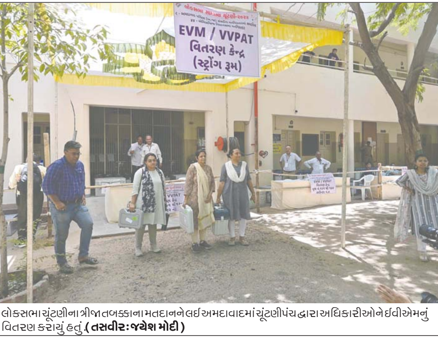
લોકસભા ચૂંટણીના ત્રીજા તબક્કાના મતદાનને લઈ અમદાવાદમાં ચૂંટણીપંચ દ્વારા અધિકારીઓને ઈવીએમનું વિતરણ કરાવ્યું હતું.

(એજન્સી) અમદાવાદ, શહેરના માવા-મીઠાઈ ફરસાણ એસોસિએશને મીઠાઈ સહિત ફરસાણ પણ આવતીકાલે માટે ૭ ટકા ડિસ્કાઉન્ટ આપ્યું છે. એટલે કે આવતીકાલે મતદાન કરો અને અમદાવાદની મીઠાઈ અને ફરસાણની દુકાનો પરથી ૭ ટકા ડિસ્કાઉન્ટ સાથે તમને ભાવતી વસ્તુ ખરીદી શકો છો. ગુજરાતભરમાં આવતીકાલે મતદાન થવા જઈ રહ્યું છે ત્યારે મતદારો વધુને વધુ મતદાન કરે તે માટે અમદાવાદના માવા-મીઠાઈ અને ફરસાણ એસોસિએશન દ્વારા આ નવતર પ્રયોગ હાથ ધરવામાં આવ્યો છે.